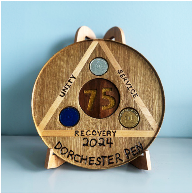
Una moneda tallada por un miembro del grupo Intramuros de Dorchester.

dice. «Ahora tenemos algunas personas muy dedicadas que vienen desde la Isla del Príncipe Eduardo a Nuevo Brunswick para ayudar con las reuniones», lo que significa que pagan un peaje de $50 para atravesar un puente y hacen un viaje de ida y vuelta de cuatro a siete horas para apoyar a los miembros reclusos.