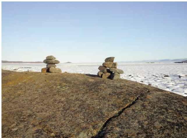
Les Inukshuk sont des constructions de pierre brute que les Inuits utilisaient pour communiquer et survivre ; on les utilisait pour donner des directions, avertir de dangers et laisser divers messages.