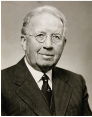
Dr. Harry Emerson Fosdick

Dans son évaluation, le Dr Fosdick a plaidé en faveur du groupe naissant et de sa feuille de route vers le rétablissement. « Ce livre est l'expérience cumulée de cent hommes et femmes qui ont été victimes de l'alcoolisme – dont plusieurs avaient été déclarés cas désespérés par les experts – et qui ont retrouvé leur liberté, leur santé mentale et la maîtrise de leur vie. Leurs histoires sont détaillées et circonstanciées, et très humaines. Aujourd'hui, l'alcoolisme est en progression