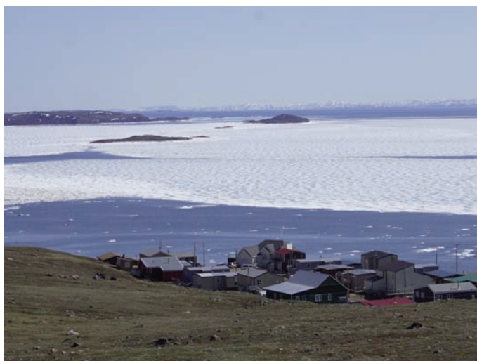
La communauté Iqaluit à la baie Iqaluit (autrefois Frobisher)

La demande d'aide de Nunavik en 1995 a été l'étincelle qui a mené la Région 90 à s'engager à transmettre le message des