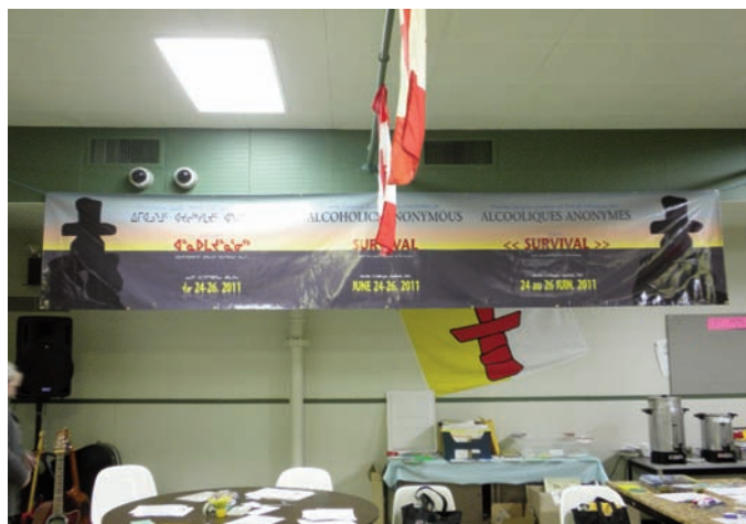
La salle de Conférence, où a eu lieu la réunion, avec la bannière en inuktitut, anglais et français.

Comme il arrive souvent lors d'événements des AA, lorsqu'un décompte d'abstinence est pris à la fin du congrès, quatre jeunes Inuits se sont identifiés comme alcooliques potentiels avec moins d'une semaine d'abstinence. On leur a remis une médaille d'abstinence et un Gros Livre. De plus,