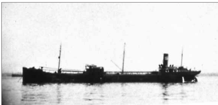
Le Capitaine Jack est demeuré abstinent sur ce pétrolier pendant 14 mois en correspondant avec le BSG et en faisant des Douzième Étapes auprès d'autres marins.

Il a aussi voyagé à Palembang, à l'Île Sumatra, qui fait maintenant partie de l'Indonésie, mais auparavant, il était aux Indes néerlandaises. À Palembang, il a pris contact