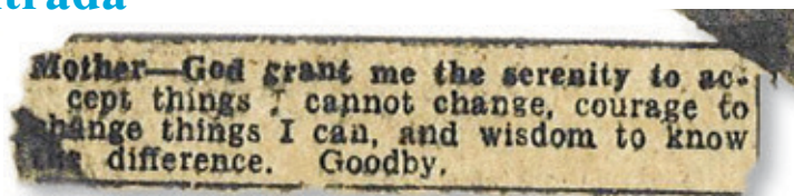
Este recorte del texto de la Oración de la Serenidad apareció en 1941 en el New York Herald Tribune.