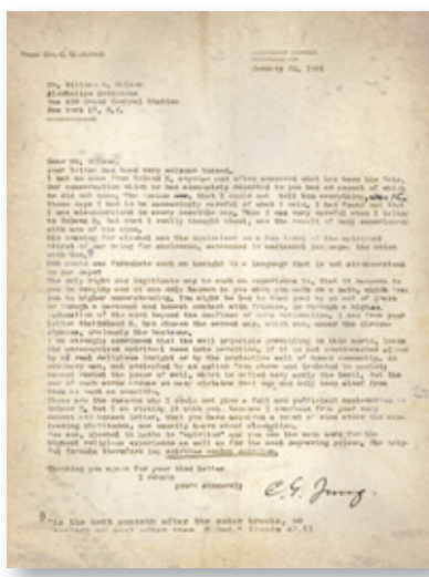
Carta del Dr. Carl G. Jung a Bill W. — 1961 Hay una copia enmarcada en los Archivos de la OSG.

Bill escribió otra carta al Dr. Jung, pero Jung murió antes de poder responder. Afortunadamente, Bill ya había expresado al Dr. Jung el agradecimiento de la Comunidad y había aplaudido los esfuerzos de ese fundador de A.A.